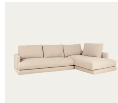
Chaise longue destra

Divano modulare: Misura ogni modulo e calcola la dimensione totale per assicurarti che il divano modulare si adatti correttamente allo spazio, considerando le possibili configurazioni.