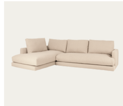
Chaise longue izquierda

Sofá con chaise longue: Decide la orientación (derecha o izquierda) según cómo veas el sofá de frente, ya que esto impacta el espacio disponible en la habitación y la distribución del entorno.