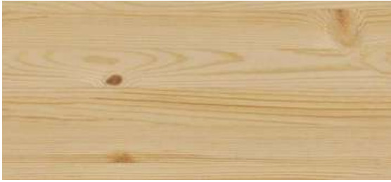
MADERA DE PINO

La madera es uno de los materiales con el que nos encanta crear nuestras piezas y con la que conseguimos que cada una de ellas sea única. En decowood nos encanta utilizar la madera de pino y la madera de abeto, entre otras. Dependiendo del tipo de madera y el tono que elijas, el resultado puede ser muy diverso. Por eso mismo hemos creado este apartado para ayudarte a elegir la mejor opción para ti.