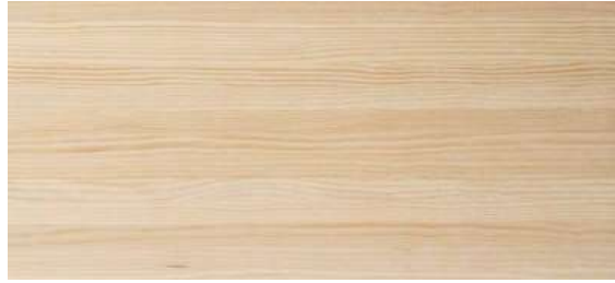
MADERA DE ABETO

Madera sutilmente más amarillenta. Nudos más espaciados y de mayor tamaño. Más cantidad de vetas, éstas son rectas y pronunciadas.